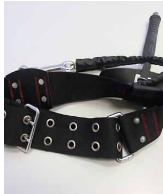
Feuerwehr-Haltegurt Typ A

Die Fachgruppe „Feuerwehren – Hilfeleistung“ der Deutschen Gesetzlichen Unfallversicherung hat in den Jahren 2007 und 2010 ebenfalls entsprechende Prüfungen mit nunmehr noch älteren Gurten durchführen lassen. Die Prüfergebnisse haben jeweils das Prüfergebnis der HFUK von 2006 bestätigt, so dass beabsichtigt ist, die GUV-G 9102 entsprechend zu ändern. Damit wird dann wieder bundeseinheitlich eine gleiche Gebrauchsdauer gelten: Für Gurte der Form A nach DIN 14926 und 14927 zwölf Jahre und für Gurte der Form B nach DIN 14926 und 14927 zehn Jahre. Für Gurte der Form B kommt eine Gebrauchsdauererweiterung auf Grund der Prüfergebnisse nicht in Frage.