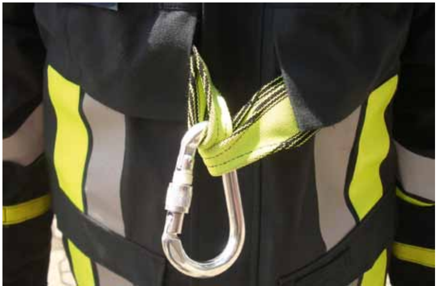
In eine Feuerwehrjacke integrierte Sicherungsschlaufe

Ob es mit dieser Methode oder unter Verwendung einer Bandschlinge oder einer Feuerwehr-Einsatzüberjacke mit integrierter Rettungsschlaufe in der absoluten Notsituation gelingt, den richtigen Anschlagpunkt zu finden und auszuwählen, Knoten fehlerfrei zu machen, scharfe Kanten, Scherben zu meiden, alles richtig zu machen (mögliche thermische Einflüsse mal außer acht gelassen), darf zumindest in Frage gestellt werden. Aber von all dem hängt das Ergebnis eines Selbstrettungsversuches ab.