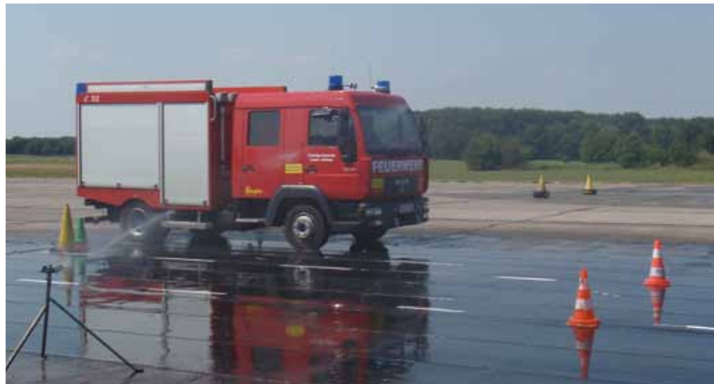
Ein TSF-W mit 7,5 Tonnen Fahrgestell bei einem Fahrsicherheitstraining

Auch Fahrübungen, mit denen man die Ausmaße des Fahrzeugs kennenlernt, sind sehr hilfreich. Hier verweisen wir gern auf den Folgebeitrag zu den „Fahrübungen“, die die HFUK Nord in ihrem Internetauftritt unter www.hfuk-nord.de