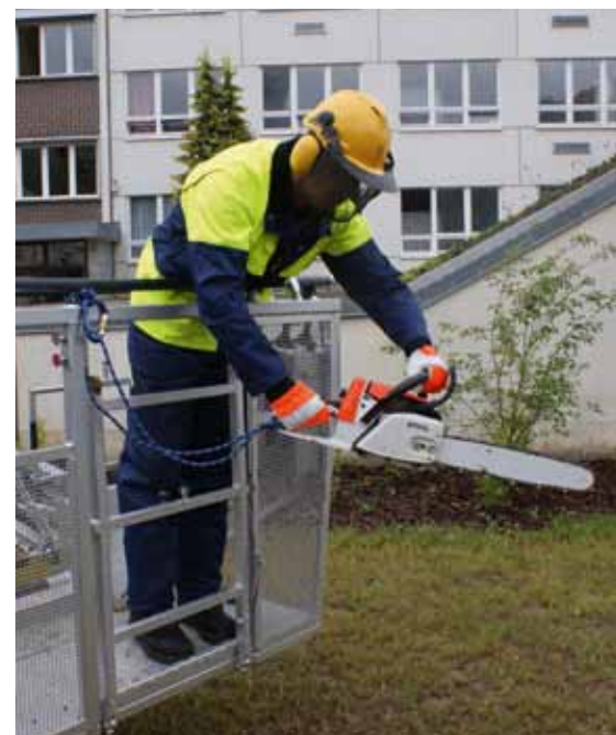
Einsatz der Motorsäge vom Korb einer Drehleiter aus