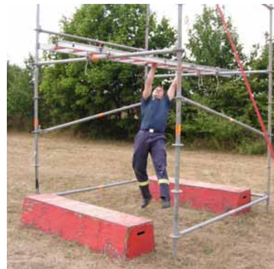
Station „Klettergerüst“: Ein Absturz aus größeren Höhen muss unbedingt ausgeschlossen werden.

Die Außenwirkung kann in solchen Fällen auch imageschädigend für die Feuerwehr sein, da sie sich allzu sehr als Spaßtruppe darstellt. Die Professionalität, mit der sie sonst arbeitet, wird bei Unfällen, die dann öffentlichkeitswirksam bei Wettkämpfen passieren, zu Recht in Frage gestellt. Solche Spiele enden lei-