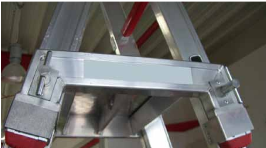
Bild 1: Bockleiter aus zwei Steckleiterteilen und einem Steckleiterverbindungsteil

Beim Kombinieren von Steckleiterteilen (EN 1147) verschiedener Hersteller mit Hilfe eines Steckleiterverbindungsteils zu einer Bockleiter kam es bei einer Feuerwehr zu einem schweren Unfall, weil sich das Steckleiterverbindungsteil aus dem Steckleiterteil löste. Aus diesem Grund sollten beim Einsatz einer Bockleiter ausschließlich Teile des gleichen Herstellers verwendet werden.