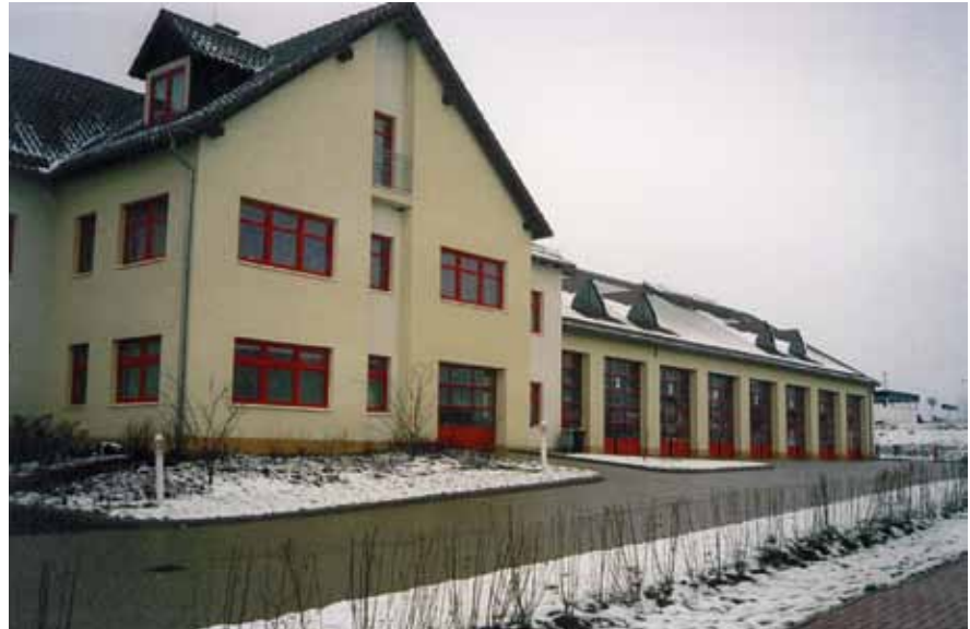
Achtung glatt: Die Wege rund um das Feuerwehrhaus müssen auch im Winter gefahrlos begehbar sein. Räum- und Streudienst vor dem ersten Eis und Schnee regeln!

besonderer Bedeutung und immer wieder thematisiert ist das Fahren von Feuerwehrfahrzeugen mit Winterreifen (Winterreifenpflicht beachten!) Mit Veröffentlichung der neuen Vorschriften der Straßenverkehrs-Ordnung am 03.12.2010 im Bundesgesetzblatt, ist die sogenannte „Winterreifenpflicht“ seit dem 04.12.2010 konkretisiert worden und in Kraft getreten und auch für Feuerwehrfahrzeuge verbindlich.