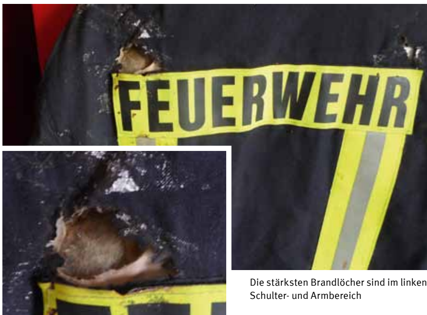
Die stärksten Brandlöcher sind im linken Schulter- und Armbereich

Diese Schädigung lässt die Tiefe der Brandlöcher erkennen