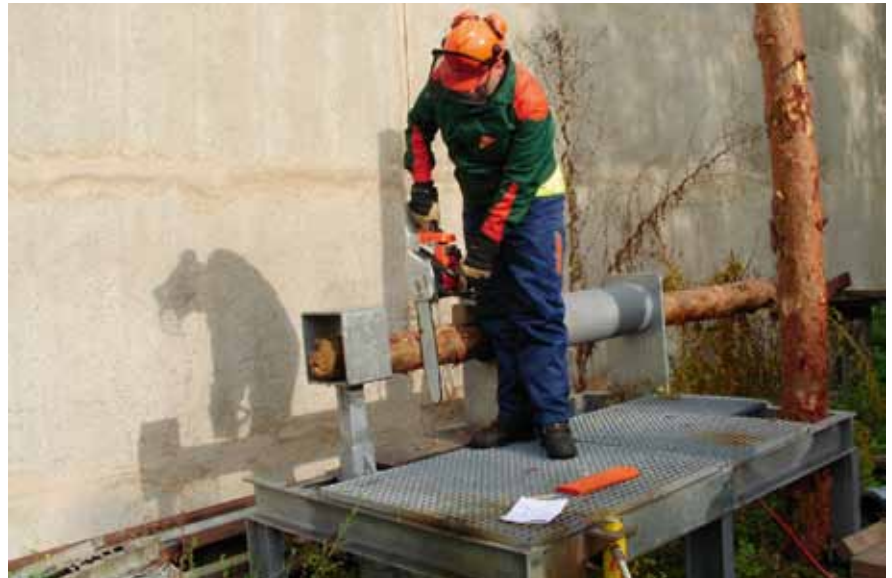
Schneiden von unter Spannung stehendem Holz an einem Baumbiege-Simulator

Die praktische Ausbildung darf nur von Personen durchgeführt werden, die aufgrund eigener Qualifikation und praktischer Erfahrungen die erforderlichen Kenntnisse erworben haben. Sie kann insbesondere durch forstwirtschaftliche Meister mit Zusatzqualifikation für Berufs- und Arbeitspädagogik (BAP) bzw. durch einen Forstingenieur oder durch einen Ausbilder für Motorkettensägenführer (z.B. Lehrgang an der Landesfeuerwehr- und Katastrophenschutzschule Thüringen) durchgeführt werden.