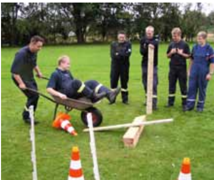
Volks-Belustigung mit Hang zum Imageschaden für die Feuerwehr: Schubkarrenrennen sind sehr unfallträchtig.

Die Aufsichts- und Beratungsdienste der Feuerwehr-Unfallkassen sind daher seit Jahren bemüht, das Unfallgeschehen im Bereich der Wettkämpfe zu reduzieren. Bei Amtsfestwehrtagen, Jubiläen, Fahrzeugübergaben und weiteren Anlässen werden sehr häufig Feuerwehrwettkämpfe angeboten, bei denen es auf Geschick, Geschwindigkeit, Kraft oder weitere Eigenschaften der Feuerwehrangehörigen ankommt. Im Vordergrund dieser Aktivitäten steht neben Vergleichsübungen wie dem 105 Meter Schlauchlegen oder der Einsatzübung nach FwDV3 auf Zeit, der Spaß an der Sache. Je lustiger oder ausgefallener die Wettkämpfe sind, umso besser.