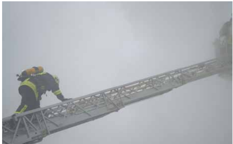
Leitersteigen im Feuerwehrdienst ist immer wieder eine besondere Herausforderung, welche nur freiwillig, nach entsprechender Ausbildung und Training sowie im körperlich fitten Zustand vorgenommen werden sollte.

liche Recht noch weitergehende gesetzliche Bestimmungen fordern derzeit eine Steigschutzeinrichtung für das Besteigen