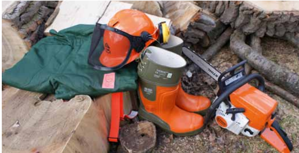
Persönliche Schutzausrüstung für Arbeiten mit der Motorsäge