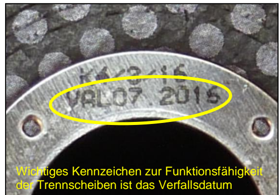
Wichtiges Kennzeichen zur Funktionsfähigkeit der Trennscheiben ist das Verfalldatum

Eine Kennzeichnung muss dauerhaft lesbar sein.